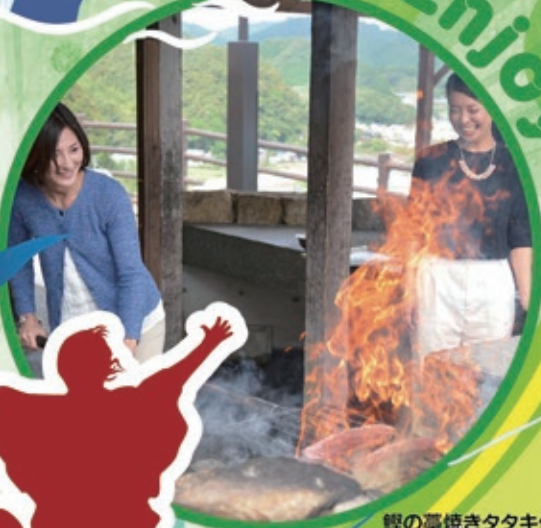
鯉の薫焼きタタキ体験