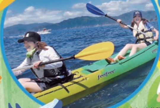
シーカヤック体験