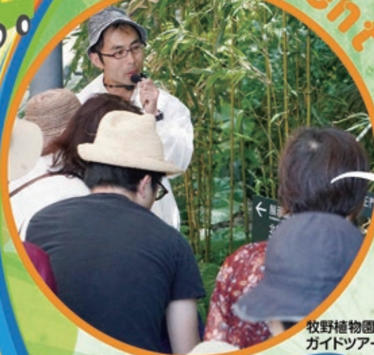
牧野植物園 ガイドツアー